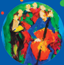
Octuor - Sire